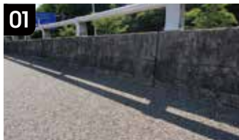
01 경계부 이물질 청소