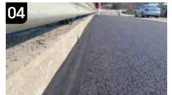
04 시공 완료