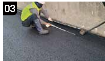
03 압착 시공