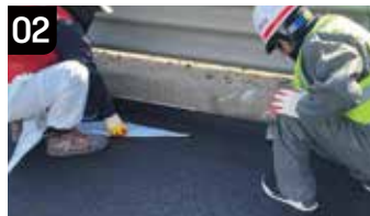
02 이형지 제거 및 부착